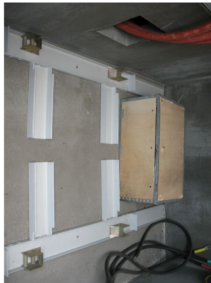
Рамка за монтаж на Тр-р